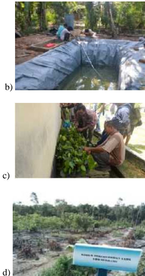
Gambar 1: a) Penyuluhan Budidaya dan penanganan pasca panen lada ramah lingkungan, b) Demonstrasi plot bak perendaman lada, c) Pemilihan bibit berkualitas dan bebas penyakit, d) Kebun percontohan lada di Desa Serdang.