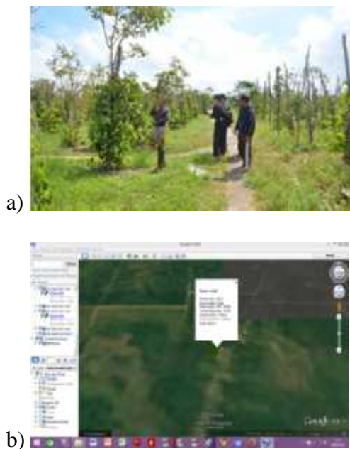
Gambar 3 berikut menunjukkan dokumentasi selama kegiatan berlangsung

berkembang mengikuti perkembangan zaman. Salah satu teknologi tersebut adalah Global Positioning System (GPS). Teknologi ini berguna untuk pengindraan jarak jauh dan mengetahui segala informasi geografi maupun topografi suatu wilayah. Penerapan teknologi ini ke komoditi lada dapat sangat menguntungkan petani dan pihak buyer . Pemetaan menggunakan GPS bertujuan untuk melindungi lahan petani dan memberikan informasi kepada buyer luar tentang lokasi dan semua informasi terkait lada dari petani. Sehingga pihak buyer dapat memantau secara langsung produk tanpa harus datang ke lokasi produk tersebut. Dengan begitu, kepercayaan buyer terhadap produk dapat dijaga serta dapat meminimalisir oknum-oknum nakal yang memalsukan produk lada putih Muntok White Pepper saat ini. Gambar 3 berikut menunjukkan dokumentasi selama kegiatan berlangsung.