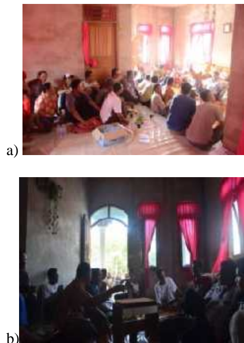
Gambar 4. Pembentukan Kelompok Tani Lada

Kegiatan ini bertujuan untuk mengumpulkan petani lada dalam sebuah kelompok tani. Tujuannya adalah untuk memudahkan penyebaran informasi dan memusatkan bantuan pemerintah. Selain itu, dengan berkelompok dapat meningkatkan bargaining position petani secara tidak langsung. Gambar 4 berikut menunjukkan dokumentasi selama kegiatan berlangsung