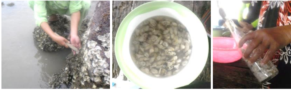
Gambar 1. Proses produksi Kecalo Teritip mulai dari pengambilan Teritip (kiri), daging Teritip kupas (tengah), dan fermentasi dalam botol (kanan).