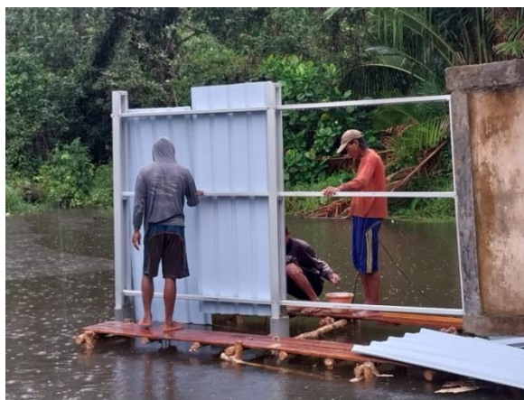
Gambar 7. Pemasangan dinding pembatas sebelah kanan

Pekerjaan setelah tiang baja dilanjutkan dengan pekerjaan kerangka untuk pemasangan dinding pembatas. Kerangka yang digunakan dari bahan baja Canal juga merk taso. Baja yang dipasang terdiri dari 3 lapis. Tiap lapis panjang baja yang dipasang sepanjang 3 m.