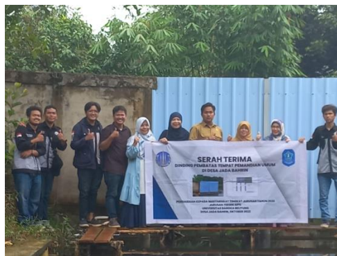
Gambar 9. Acara serah terima dinding pembatas tempat pemandian umum di lokasi tempat pemandian umum Desa Jada Bahrin

Tahapan akhir dari kegiatan pengabdian ini adalah penyerahan dinding pembatas tempat pemandian umum kepada Kepala Desa Jada Bahrin. Acara penyerahan dilakukan di ruangan kantor Desa Jada Bahrin untuk penandatanganan berita acara serah terima dan dilanjutkan dengan penyerahan di lokasi tempat pemandian umum.