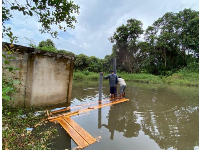
Gambar 6. Pemasangan paralon pipa untuk tiang pondasi

Pipa paralon yang dipakai diameternya 15cm adalah pipa dengan merk alderon tipe AW 6" sehingga konstruksi tiang nya bisa digunakan dalam jangka waktu yang lama. Kedalaman pipa yang dipasang sedalam 3m dari batas dinding dan dari muka air sedalam 2,6 m. Tiang yang digunakan ada 2 buah tiang paralon. Pipa yang dipasang seluruhnya 4m karena yang digunakan hanya 3m maka perlu dilakukan pemotongan.