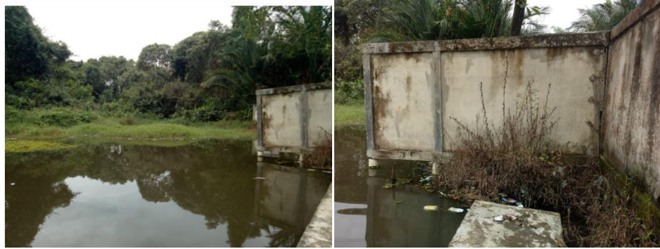
Gambar 2. Kondisi eksisting dinding tempat pemandian umum