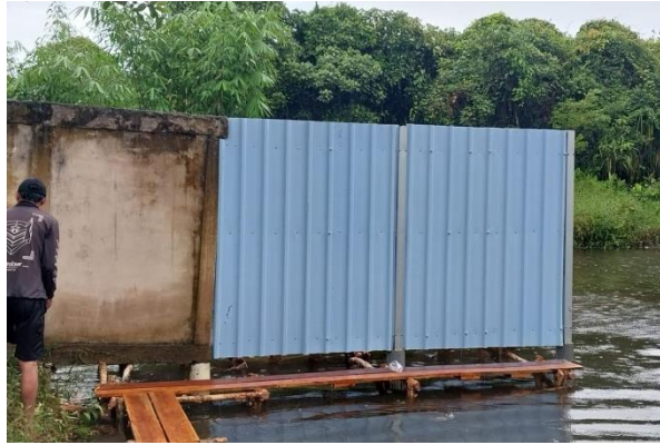
Gambar 8. Dinding pembatas yang telah selesai dibuat

Dinding pembatas yang dipasang seperti terlihat pada Gambar 7 - Gambar 8. dibuat dari bahan trimdeck alderon dengan mutu yang bagus supaya dinding pembatas ini dapat digunakan dalam jangka waktu yang lama. Dinding pembatas ini dipasang 2 lapis dan 2 bagian dengan tinggi 2m. Terdiri dari 2 lapis, yaitu lapisan sebelah kanan dan lapisan sebelah kiri. Terdiri dari 2 bagian, tiap bagian lebar nya 1,5 m x 2m, yang dibatasi dengan tiang baja.