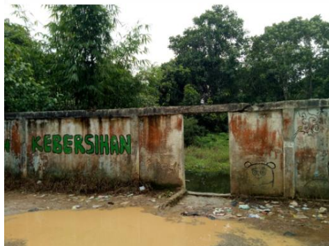
Gambar 1. Pintu masuk tempat pemandian umum

Berdasarkan permasalahan diatas yang bercampurnya pemandian antara jenis kelamin laki-laki dan perempuan, maka untuk mengatasi hal-hal yang kurang baik perlu dibuatkan dinding pembatas pemandian antara laki-laki dan perempuan sehingga yang menggunakan tempat pemandian ini merasa nyaman untuk melakukan aktivitas mandi maupun mencuci pakaian dan hal-hal yang lainnya. Kondisi eksisting sekarang ini baru sebagian kecil dinding yang dibuat sehingga belum begitu menutupi dan masih terbukanya kondisi tempat pemandian. Oleh karena itu, perlu dilakukan penambahan pembuatan dinding pembatas tempat pemandian umum ini sampai ke bagian tengah tempat pemandian supaya masyarakat Desa Jada Bahrin merasa nyaman dalam pemakaian fasilitas umum ini [2]. Kondisi eksisting tempat pemandian umum di Desa Jada Bahrin dapat dilihat pada Gambar 1.