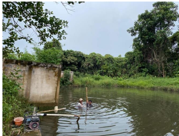
Gambar 5. Pekerjaan tiang dan alas untuk melakukan pekerjaan dinding

Desain yang telah dibuat didiskusikan dengan aparat desa, selanjutnya dilaksanakan pembuatannya yang dibantu oleh tenaga pembantu. Kegiatan pembuatan dinding pembatas tempat pemandian umum dapat dilihat pada Gambar 5 – Gambar 8.