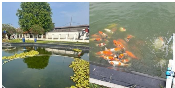
Gambar 1. Kolam Pemeliharaan Induk

Induk koi di BRBIH dipelihara terpisah antara jantan dan betina dalam kolam beton berlapis HDPE berukuran 1110 cm x 840 cm. Pemeliharaan induk bertujuan mencapai kematangan gonad optimal agar penetasan telur dapat melebihi 50%. Pakan diberikan dua kali sehari dengan metode at satiation , menggunakan pakan buatan dengan jenis pelet terapung. Produk yang digunakan Breeder Pro size Medium/5 mm dengan kandungan protein 35%.