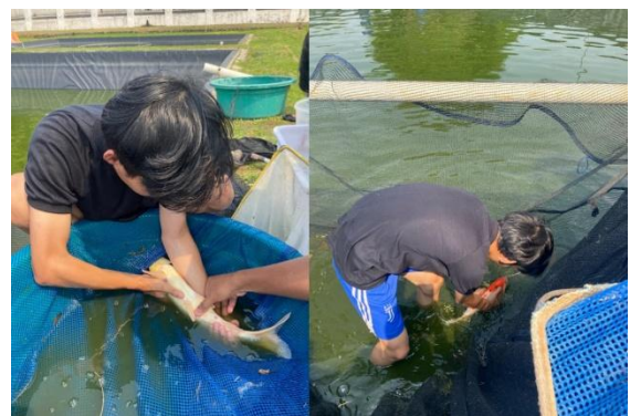
Gambar 3. Proses Seleksi Induk

Seleksi induk di BRBIH dilakukan di pagi hari. Seleksi dilakukan secara visual pada setiap indukan ikan koi jantan dan betina melalui pengamatan ciri tubuh serta pengecekan genital. Induk ditangkap menggunakan jaring, kemudian diamati satu per satu; indukan jantan dicek dengan distripping , sedangkan untuk indukan betina dicek dengan katetirisasi; dengan menggunakan kateter, memasukkan selang dari lubang genital, lalu disedot untuk menarik telur. Sebelum dilakukannya proses pemijahan, indukan koi dilakukan pemberokan untuk mengurangi lemak dan melancarkan keluarnya gamet.