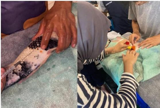
Gambar 4. Injeksi dan Pemijahan

Proses pemijahan berlangsung selama 10-12 jam setelah diinjeksi. Pada pagi hari semua indukan koi diangkat setelah proses pemijahan selesai. Induk betina dilakukannya penimbangan kedua untuk mengetahui bobot gonadnya setelah mengeluarkan telur. Selanjutnya semua indukan dikembalikan ke kolam indukan.