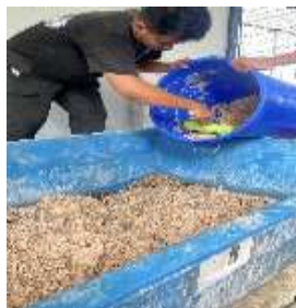
Gambar 6. Pemeliharaan larva sekaligus pemberian pakan.

Pemberian makanan berupa bahan organik basah seperti sisa makanan, sayuran, buah-buahan, ampas kelapa. Pemberian makanan sesuai dengan ketersediaan bahan organik, pemberian makanan /pakan larva dilakukan beberapa sesi pada hari Senin, Rabu, Jumat biasanya diberikan limbah organik dari warga sekitar berupa sisa makanan, buah-buahan, sayuran, dan pada hari Selasa dan Jumat bisa dilakukan pengambilan limbah organik dari hotel di dekat Balai Riset Budidaya Ikan Hias, Depok. Limbah dari hotel berupa sisa makanan, buah-buahan, sayuran, dan ampas kelapa.