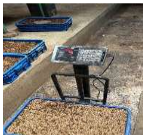
Gambar 7. Panen Larva BSF.

Proses pemanenan Black Soldier Fly (BSF) dilakukan setelah masa pemeliharaan selama 17 hari. BSF dipisahkan dan dibersihkan dari sisa media pertumbuhan mulai penyaringan menggunakan ayakan guna memisahkannya dari residu media tumbuh dan kotoran. Selanjutnya, BSF ditimbang untuk menentukan hasil akhir dari satu siklus budidaya (Fauzi dan Sari, 2018).