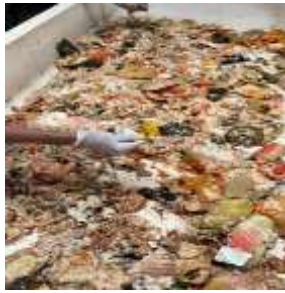
Gambar 5. Persiapan media tumbuh berupa food waste.