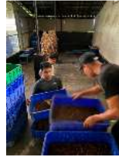
Gambar 2. Substrat daun pisang kering.

Pada tahap awal budidaya lalat BSF, dalam kadang juga telah di berikan beberapa tumbuhan seperti daun pisang kering yang berfungsi sebagai tempat istirahat atau menempel lalat.