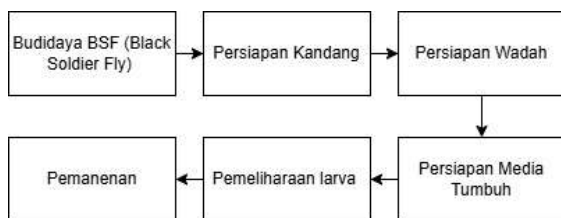
Gambar 1. Prosedur Kerja

Prosedur kerja pada Praktik Kerja Lapang ini dapat dilihat pada Gambar berikut.