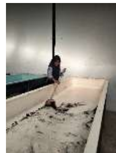
Gambar 4. Persiapan bak wadah budidaya.

Pada pengamatan, wadah yang digunakan sebagai media pertumbuhan maggot atau BSF berupa nampan plastik dengan ukuran 4 m x 1,5m x 0,20m. Sebelum digunakan, wadah tersebut terlebih dahulu dibersihkan dari sisa kotoran.