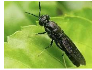
Gambar 10. Hermetia illucens

Kingdom : Animalia Filum : Arthropoda Class : Insecta Ordo : Diptera Famili : Stratimyidae Genus : Hermetia Spesies : Hermetia illucens