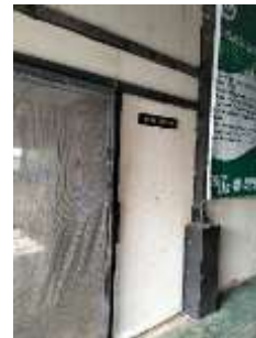
Gambar 3. Kandang Lalat BSF.

Kandang yang digunakan umumnya berbentuk ruangan persegi empat yang dibangun dari kayu dengan dimensi 7 x 7 m . Seluruh kandang dilengkapi dengan jaring untuk mencegah masuknya hewan lain ke dalam kandang. Selain itu, lokasi kandang ditempatkan di area yang berdekatan dengan paparan sinar matahari, namun tidak berlebihan.