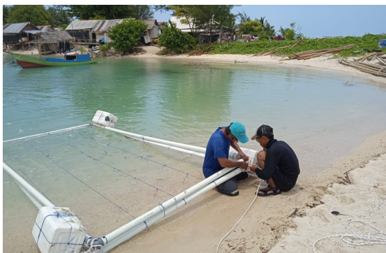
Gambar 1. Pembuatan Rakit Apung dan Media Budidaya E. cottonii di Pulau Semujur Bibit Rumput Laut

laut diikatkan pada titik-titik tertentu menggunakan simpul hidup. Rancangan rakit apung ditampilkan pada Gambar 1.