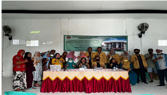
Foto bersama para peserta warga desa Srijaya- Tambun Utara – Kab. Bekasi