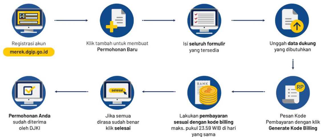
Gambar 2 : Tata Cara Pendaftaran Merek

Perlindungan hukum terhadap merek di Indonesia diperoleh melalui mekanisme pendaftaran merek pada Direktorat Jenderal Kekayaan Intelektual (DJKI). Sebelum mengajukan permohonan, pemohon wajib menyiapkan beberapa persyaratan, yaitu etiket atau label merek, tanda tangan pemohon, serta bagi pelaku Usaha Mikro dan Kecil (UMK) melampirkan Surat Rekomendasi atau Surat Keterangan sebagai UMK binaan dari dinas terkait dan Surat Pernyataan UMK yang telah dibubuhi materai. Setelah seluruh persyaratan tersedia, pemohon terlebih dahulu membuat akun dan melakukan log in pada sistem merek elektronik DJKI melalui portal merek.