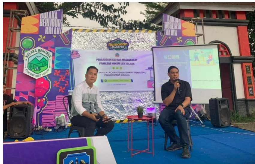
Gambar 1 : Penyampaian Materi Pendaftaran Merek

Kegiatan edukasi ini merupakan hasil kolaborasi strategis antara Fakultas Hukum USN Kolaka dengan "Kolaka Berlibur", selaku pihak penyelenggara Bazar Ramadhan Mubarak 2026. Sinergi ini memungkinkan para akademisi untuk terjun langsung dan berinteraksi dengan para pengusaha kuliner serta produk kreatif lainnya di tengah keramaian bazar. Momentum bulan suci Ramadhan yang identik dengan meningkatnya aktivitas ekonomi UMKM dimanfaatkan secara optimal untuk memberikan penyuluhan hukum yang relevan dan mendesak, yakni terkait perlindungan kekayaan intelektual melalui pendaftaran merek.