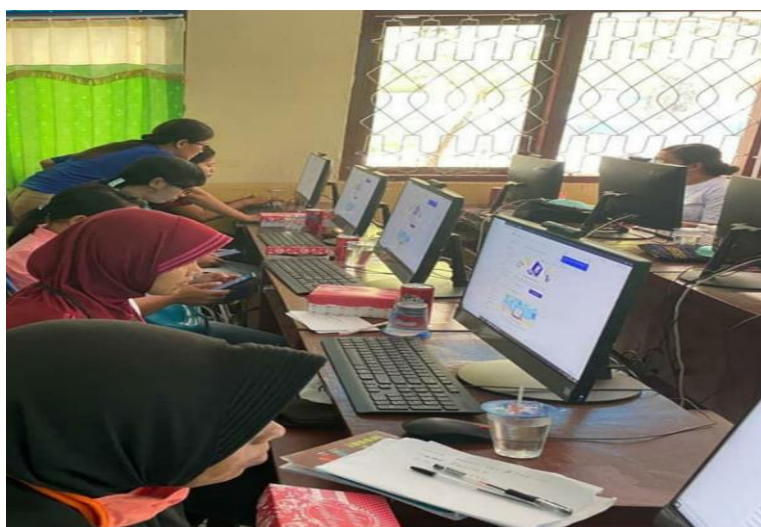
Gambar 1. Para Guru memahami konsep e-learning melalui pembuatan akun Edmodo dipandu oleh Tim Pengabdian

Kegiatan pelaksanaan pengabdian e- learning menggunakan edmodo di SMPN 1 NDONA telah dilakukan selama 2 hari di ruangan laboratorium komputer. Adapun dalam pelaksanaan pengabdian pelatihan dan sosialisasi aplikasi edmodo tersebut guru- guru di SMPN 1 NDONA mengikutinya dengan antusias. Pada pengabdian masyarakat ini guru-guru diajarkan membuat akun di Edmodo untuk diterapkan dalam proses pembelajaran. materi yang diajarkan antara lain membuat akun Edmodo, membuat grup/ kelas di Edmodo, serta memanfaatkan fitur-fitur yang ada di Edmodo antara lain: pembuatan note, assignment, quiz dan polling.