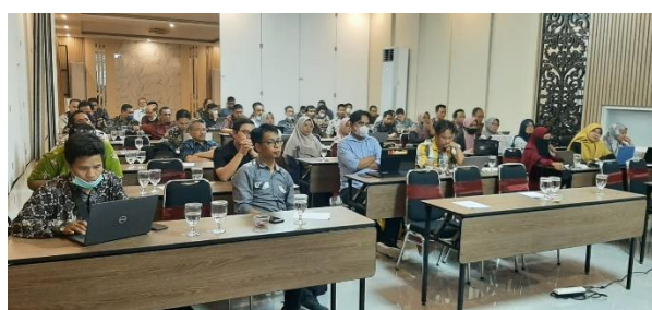
Gambar 3. Sesi Tanya Jawab dan Diskusi

Materi terakhir tentang langkah-langkah mengatasi kelemahan siswa akibat learning loss . Upaya guru sebagai garda terdepan dalam meminimalisir akibat dari learning loss sebagai berikut: (1) pendampingan psikososial bagi guru dan siswa guna pemulihan psikologis sebelum pelaksanaan pembelajaran tatapmuka; (2) penyiapan dan memastikan siswa 100% siap untuk melaksanakan pembelajaran pada masa kenormalan baru; (3) penyiapan dan pelaksanaan kurikulum merdeka guna penanggulangan pembelajaran pasca covid-19; (4) pemanfaatan teknologi sebagai sumber, media, dan bahan ajar sebagai penguatan pemahaman, keterampilan, serta penguatan karakter siswa; (5) merancang pembelajaran yang bervariasi sesuai dengan kemampuan, bakat dan minat peserta didik (Pembelajaran Berdasarkan Kebutuhan Peserta didik); (6) melakukan pendekatan yang baik, sehingga bahwa peserta didik termotivasi untuk terlibat aktif dalam pembelajaran jarak jauh; (7) menggunakan pendekatan lain jika diindikasikan bahwa ada peserta didik yang memiliki komunikasi online yang terbatas; dan (8) koordinasi dan komunikasi antara guru dan orang tua [26-28].