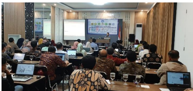
Gambar 2. Penyampaian Materi oleh tim Pengabdian

Materi kedua tentang asesmen literasi dan numerasi siswa di SD. Asesmen adalah suatu proses pengumpulan data tentang perkembangan belajar peserta didik, baik dalam bentuk angka maupun deskripsi, menggunakan multimetode dan multi instrumen sebagai dasar pengambilan keputusan [19, 20]. Asesmen dapat dikatakan sebagai penilaian proses, perkembangan, serta hasil belajar siswa [21]. Dengan demikian asesmen adalah istilah yang tepat untuk mengukur proses belajar siswa. Sebagai perwujudannya, salah satu bentuk asesmen di sekolah sebagai pengganti ujian nasional yaitu dilakukan Asesmen Kompetensi Minimum (AKM) [22, 23].