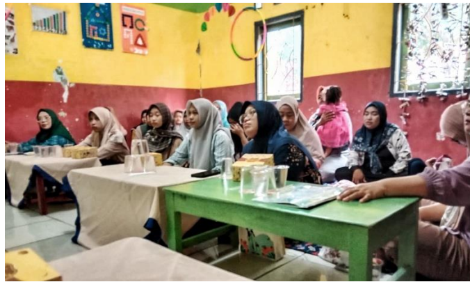
Gambar 2. Gambaran peserta pelatihan Bina Orang Tua dengan tema “Cara Optimal Belajar AUD” tanggal 27 Januari 2025

Pelatihan ini secara garis besar dibagi menjadi 5 sesi. Sesi pertama diawali dengan pendahuluan, dimana penulis sebagai pemateri memperkenalkan diri kepada peserta, memberikan ice breaking guna mencairkan suasana pelatihan agar terasa lebih hangat dan nyaman bagi peserta, menjelaskan manfaat dan tujuan pelatihan, serta menjelaskan secara singkat highlight dari materi pelatihan kepada peserta. Sesi berikutnya adalah pemberian pre-test, dimana pemateri dibantu oleh panitia memberikan pre-test tertulis kepada para peserta pelatihan dan memberikan waktu sekitar 15 menit untuk mengisinya. Sesi ketiga atau sesi ceramah adalah sesi inti dari pelatihan ini, dimana penulis memaparkan materi-materi pelatihan kepada para peserta. Materi pelatihan yang disampaikan berkaitan dengan definisi belajar, tahapan pembelajaran sesuai dengan tingkat perkembangan, cara dan metode belajar anak usia dini (AUD), hal-hal yang harus dihindari pada penerapan metode belajar AUD, dan sebagainya. Setelah penyampaian materi berakhir, sesi berikutnya adalah sesi tanya jawab yang berlangsung selama 30 menit. Pemateri menjawab sekitar 5 buah pertanyaan yang diajukan oleh para peserta terkait dengan materi pelatihan. Sesi terakhir adalah pemberian post-test untuk mengetahui ada atau tidaknya peningkatan pemahaman dan pengetahuan peserta pelatihan terkait materi yang telah disampaikan sebelumnya. Kemudian seluruh sesi pelatihan ditutup dengan foto bersama.