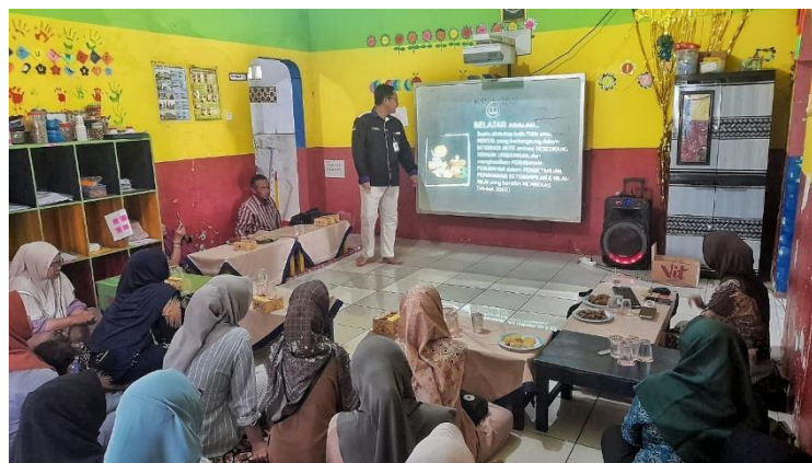
Gambar 3. Penyampaian materi pelatihan

Pelatihan ini secara garis besar dibagi menjadi 5 sesi. Sesi pertama diawali dengan pendahuluan, dimana penulis sebagai pemateri memperkenalkan diri kepada peserta, memberikan ice breaking guna mencairkan suasana pelatihan agar terasa lebih hangat dan nyaman bagi peserta, menjelaskan manfaat dan tujuan pelatihan, serta menjelaskan secara singkat highlight dari materi pelatihan kepada peserta. Sesi berikutnya adalah pemberian pre-test, dimana pemateri dibantu oleh panitia memberikan pre-test tertulis kepada para peserta pelatihan dan memberikan waktu sekitar 15 menit untuk mengisinya. Sesi ketiga atau sesi ceramah adalah sesi inti dari pelatihan ini, dimana penulis memaparkan materi-materi pelatihan kepada para peserta. Materi pelatihan yang disampaikan berkaitan dengan definisi belajar, tahapan pembelajaran sesuai dengan tingkat perkembangan, cara dan metode belajar anak usia dini (AUD), hal-hal yang harus dihindari pada penerapan metode belajar AUD, dan sebagainya. Setelah penyampaian materi berakhir, sesi berikutnya adalah sesi tanya jawab yang berlangsung selama 30 menit. Pemateri menjawab sekitar 5 buah pertanyaan yang diajukan oleh para peserta terkait dengan materi pelatihan. Sesi terakhir adalah pemberian post-test untuk mengetahui ada atau tidaknya peningkatan pemahaman dan pengetahuan peserta pelatihan terkait materi yang telah disampaikan sebelumnya. Kemudian seluruh sesi pelatihan ditutup dengan foto bersama.