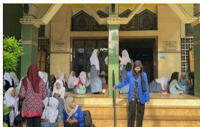
Gambar 2. Setiap pagi, siswa SMK Muhammadiyah 4 Kalisat melaksanakan salat dhuha berjamaah

Terdapat beberapa agenda rutin yang dilaksanakan oleh mahasiswa magang FKIP UMJ di SMKM 4 Kalisat, diantaranya adalah setiap pagi, secara rutin mahasiswa bersama para siswa rutin melaksanakan salat dhuha. Kegiatan ini dilaksanakan sebagai upaya penanaman kebiasaan beribadah, terutama sebelum memulai kegiatan sekolah yang padat, sehingga diharapkan dapat memupuk rasa ketakwaan di kalangan siswa secara bersama-sama.