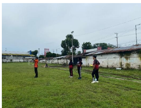
Gambar 7. Penilaian Ujian Praktek pada kelas 12