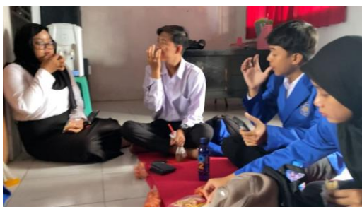
Gambar 4. Menyambut siswa di depan dan menyusun jadwal piket bersama mahasiswa prodi lain

diantaranya adalah dalam kegiatan penyambutan siswa di depan sekolah tiap pagi juga dalam penyusunan jadwal piket bersama dengan prodi lain. Tahapan kegiatan ini diharapkan dapat membentuk dan melatih kemampuan para mahasiswa magang agar dapat berkomunikasi dan berinteraksi dengan baik kepada masyarakat kelak.