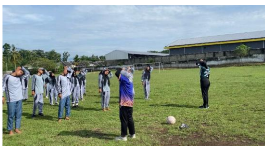
Gambar 6. Mahasiswa memimpin pemanasan sebagai pembuka interaksi dengan siswa di lapangan

Dalam proses pembelajaran yang dilakukan para mahasiswa magang kerap memberikan permainan-permainan yang mendukung proses belajar. Hal ini bertujuan agar para siswa merasa tidak bosan dengan kegiatan belajar mengajar yang dilakukan. Sebagai penutup kegiatan, di akhir kegiatan magang dilakukan penilaian berupa ujian praktik sesuai dengan rencana pembelajaran yang telah disusun.