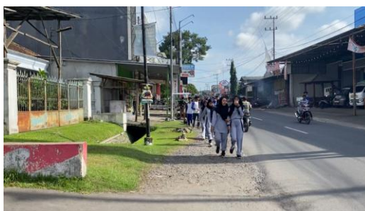
Gambar 5. Pengabdian saat siswa-siswi menuju lapangan

Sebagai salah satu program utama kegiatan magang mahasiswa, dilaksanakan kegiatan pelatihan dan pembimbingan para siswa SMKM 4 Kalisat terkait dengan kegiatan keolahragaan atau kesehatan jasmani. Kegiatan ini dilakukan secara rutin di lapangan terdekat dan diikuti oleh para siswa yang mendapat jam pelajaran olahraga secara bergantian. Diharapkan melalui kegiatan ini para siswa memiliki kesehatan jasman serta kemampuan berolahraga yang baik.