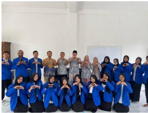
Gambar 1. Penerjunan magang FKIP UMJ di SMKM 4 Kalisat

Kegiatan magang diawali dengan kegiatan penerjunan mahasiswa magang FKIP UMJ pada sekolah SMKM 4 Kalisat. Penerjunan magang FKIP UMJ ke SMKM 4 Kalisat dilakukan pada 13 Januari 2025. Tahapan kegiatan ini diikuti secara antusias oleh para peserta kegiatan dan pihak sekolah seperti disajikan pada Gambar 1.