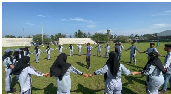
Gambar 7. Pembelajaran dengan permainan agar siswa tidak bosan