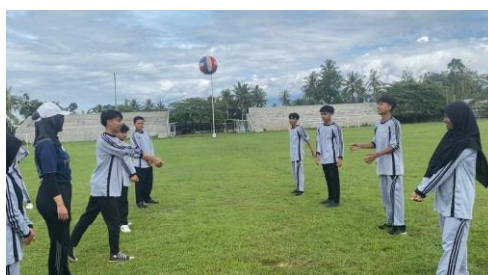
Gambar 9. Penilaian Mengajar Mahasiswa dengan rpp/modul ajar