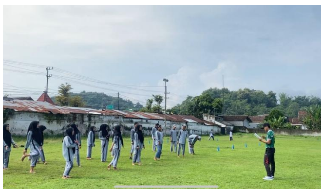
Gambar 2. Mendemonstrasikan Modifikasi Alat Pembelajaran Tolak Peluru

Selama sesi latihan seperti ditunjukkan pada Gambar 2, siswa dibagi menjadi kelompok kecil, yang memungkinkan mereka untuk mendapatkan bimbingan lebih intensif dari fasilitator. Dengan menggunakan bola tenis sebagai pengganti peluru, siswa merasa lebih nyaman dan aman saat berlatih, yang berdampak positif pada motivasi mereka untuk berlatih [9]. Setiap kelompok melakukan praktik selama 30 menit, di mana mereka dapat berlatih secara bergantian. Fasilitator memberikan umpan balik langsung, yang membantu siswa memperbaiki teknik mereka secara real-time .