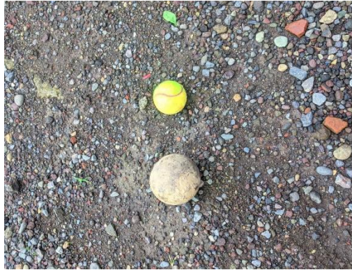
Gambar 2. Alat Modifikasi Pembelajaran Tolak Peluru