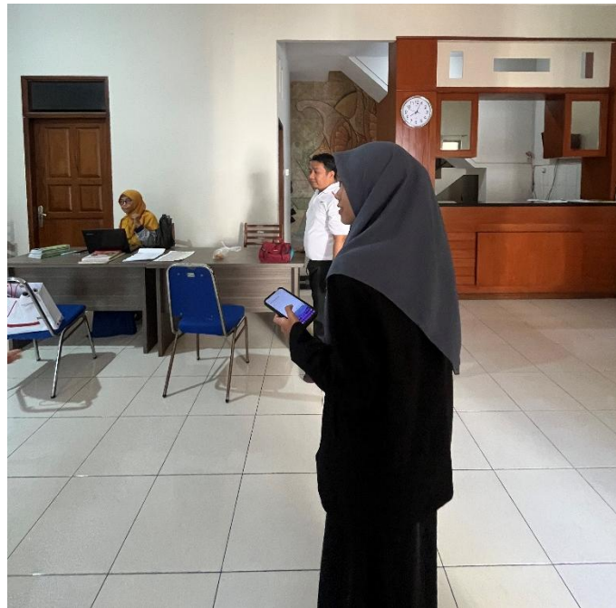
Gambar 3. Tim PMM Melakukan Dokumentasi di Kampus 2

Dari hasil pendataan, diketahui bahwa inventaris Aset SD Muhammadiyah 8 Kota Malang terbagi menjadi beberapa kategori aset utama, yaitu: