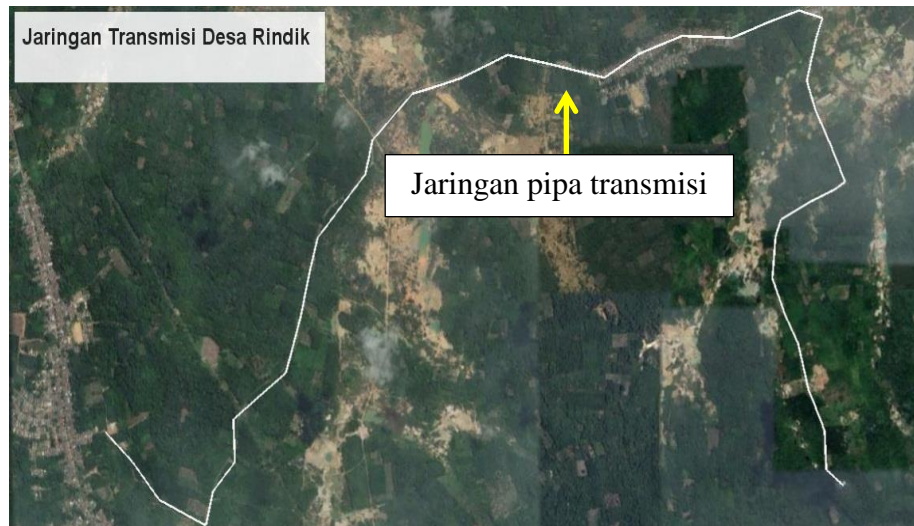
Gambar 1. Lokasi Jaringan Pipa Transmisi Desa Rindik Kabupaten Bangka Selatan

Lokasi penelitian terletak di Desa Rindik Kecamatan Toboali Kabupaten Bangka Selatan.