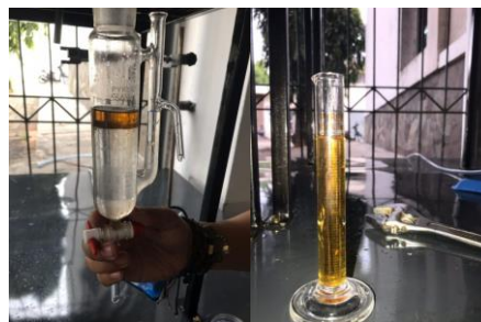
Gambar 4 Hasil minyak serai dari alat penyulingan

Gambar 4 adalah pemisah minyak dengan cara penyulingan uap dengan waktu penyulingan 5 jam kapasitas 4 kg minyak yg dihasilkan dalam penyulingan tersebut 10 ml.