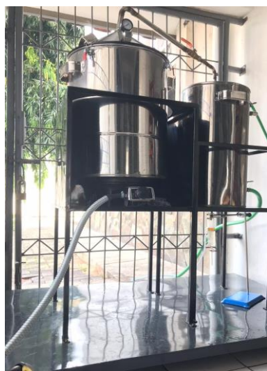
Gambar 3 Foto Alat Hasil Ekperimen

Hasil simulasi von mises stress, dengan memberikan beban maksimum menunjukkan bahwa struktur meja tangki penyulingan berada dititik aman karena tidak melewati batas maksimum yaitu 9.416 MPa. Dari hasil analisis diketahui bahwa rangka meja tangki penyulingan mengalami tegangan maksimal terbesar 4.202 MPa. Sedangkan tegangan minimalnya adalah sebesar 1.921 MPa.