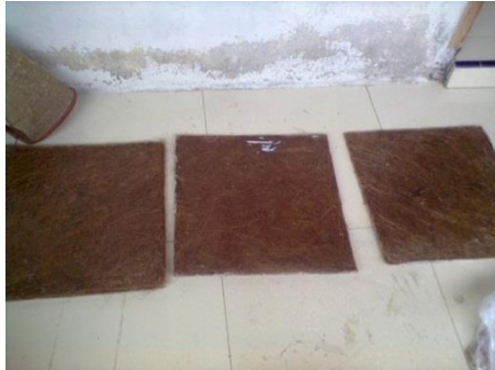
Gambar 2. Panel Panjat Tebing

Dalam Penelitian yang dilakukan membuat 3 buah benda uji panel panjat tebing yang terbuat dari serat sabut kelapa dengan rendaman NaOH 5% selama 2 jam dengan ukuran 500 mm 2 seperti pada gambar berikut: