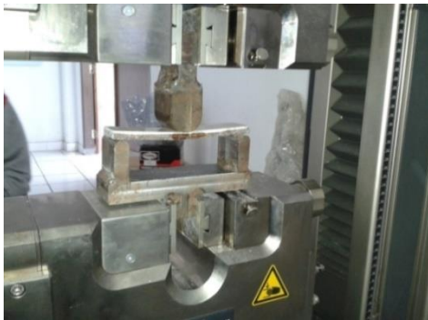
Gambar 3. Pengujian lentur komposit berserat sabut kelapa

Setelah pembuatan benda uji yang terbuat dari serat sabut kelapa ( cocos nucifera ) dilakukan pengujian lentur seperti gambar berikut :