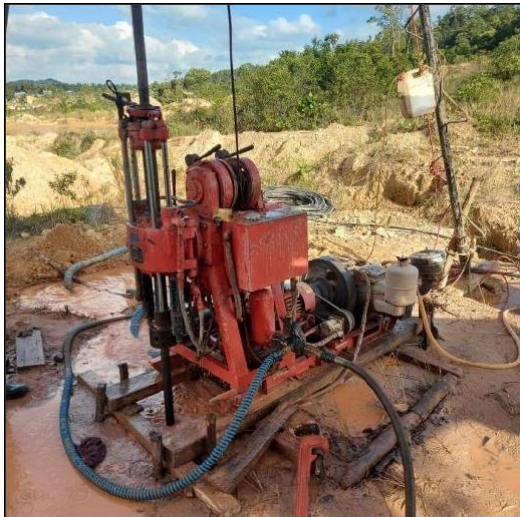
Gambar 2 Bor XY1

Penelitian ini dilakukan di PT Menara Cipta Mulia yang tepatnya di Pit Mayang. Identifikasi batuan pembentuk AAT dilakukan dengan menggunakan metode kuantitatif berupa pengambilan sampel batuan dengan bor full coring dan melakukan uji statik di laboratorium.