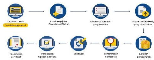
Prosedur Pendaftaran Hak Cipta