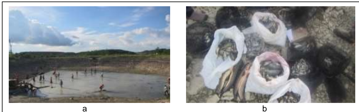
Gambar 3. Kolam Pembilasan : (a) Pengeringan Kolam Pembilasan, dan (b) Ikan Hasil Pembenihan

baku mutu yang ditentukan, sehingga air yang berada pada TSF Lebar ataupun kolam IPAL dapat dipergunakan sesuai peruntukannya. Diharapkan pengelolaan secara konsisten oleh perusahaan dilakukan sampai pascatambang berlangsung dan berakhir.