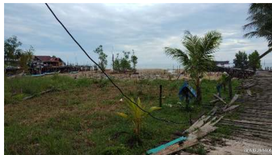
Gambar 3. Kondisi Pantai Tanjung Batu

Kawasan pemukiman Nelayan Tarakan terletak di Kelurahan Mamburungan dengan luas didaerah tanjung batu tersebut adalah sekitar 28 Ha. Dari data ketua RT/RW didapatkan bahwa penduduk tersebut yang tinggal di daerah situ adalah penduduk pendatang yang berasal dari Sulawesi, dengan 87 KK