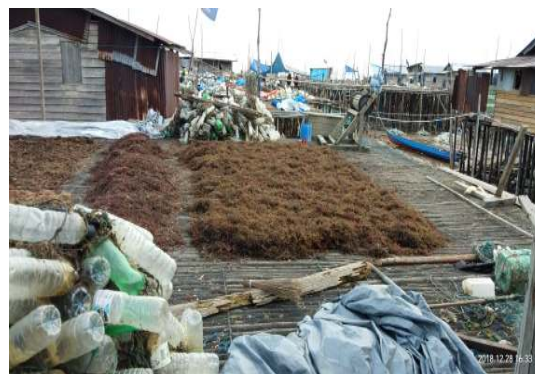
Gambar 4. Tumpukan rumput laut yang sedang di jemur

Tanjung batu ini terletak pada pesisir pantai pada bagian ujung bawah Tarakan Timur. Sehingga potensi-potensi yang dimiliki menjadikannya agar dapat berperan dalam bidang perekonomian khususnya bagian perikanan pesisir. Perpindahan penduduk yang mengarah dan mendekati dengan lokasi pekerjaan sebagai Nelayan Rumput Laut, Nelayan Ikan.