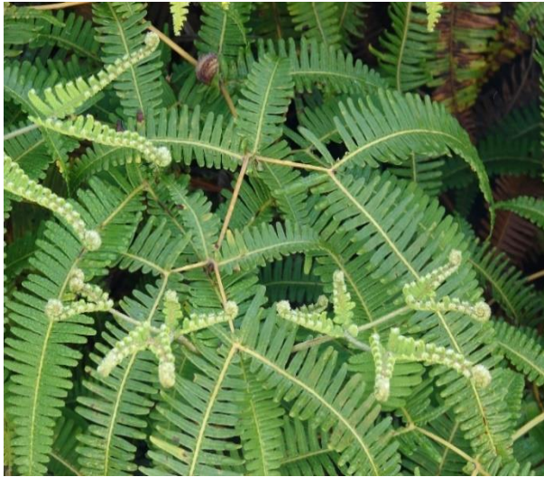
Gambar 1. Tumbuhan Resam

menunjukkan adanya peningkatan kinerja campuran beton aspal. Campuran SMA menggunakan 7% dedak padi dengan kadar aspal sebesar 6% - 7% memenuhi semua parameter marshall (Tahir, 2011).