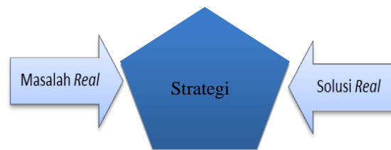
Gambar 3. Strategi Implementatif Safe City

Pada strategi ‘segi lima’ ini dapat dipahami bahwa strategi ini memberikan penekanan pada lima aspek tersebut agar memudahkan masyarakat maupun pihak-pihak terkait untuk menelaah, mendeteksi dan mengetahui dengan lebih mudah dan terarah mengenai masalah dan solusi yang dapat dilakukan dalam upaya mewujudkan kota menjadi kota yang aman.