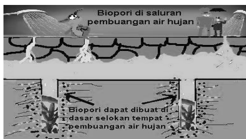
Gambar 3. Biopori di Saluran Pembuangan Air Hujan

Lubang Resapan Biopori adalah teknologi tepat guna dan ramah lingkungan untuk mengatasi banjir dengan cara (1) meningkatkan daya resapan air, (2) mengubah sampah organik menjadi kompos dan mengurangi emisi gas rumah kaca (CO 2 dan metan), dan (3) memanfaatkan peran aktivitas fauna tanah dan akar tanaman, dan mengatasi masalah yang ditimbulkan oleh genangan air seperti penyakit demam berdarah dan malaria. Lubang Resapan Biopori untuk Penanganan Sampah Organik, Seperti diketahui, sampah yang dapat digunakan untuk pengomposan ialah sampah organik atau sampah terurai, seperti sisa makanan, dedaunan, sayur, atau buah-buahan. Pengomposan dapat dibuat dalam sebuah tempat atau bila ingin lebih mudah dapat dengan mengandalkan Lubang Resapan Biopori (LRB) di sekitar rumah. Benar, bila sebelumnya yang terpikir lubang biopori berfungsi meningkatkan resapan air, ternyata lubang tersebut memiliki banyak manfaat, salah satunya untuk penanganan limbah organik.