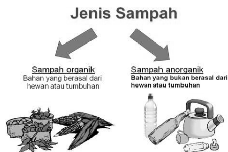
Gambar 1. Jenis-jenis Sampah

kemudian menjadi nutrisi yang sangat baik untuk pertumbuhan tanaman. Tanah menjadi lebih subur dan pihonnya bisa tambah bagus tumbuhnya.