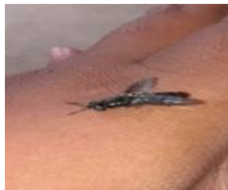
Gambar 4. Fase Lalat Dewasa

Fasa lalat dewasa merupakan fasa puncak dari siklus hidup Hermetia illucens . Dalam fasa ini lalat Hermetia illucens dapat hidup relatif singkat, yaitu 3-7 hari bergantung pada kandungan lemak yang dapat disimpan di dalam tubuhnya. Pada fasa ini lalat tidak makan melainkan hanya minum (Gligorescu dkk, 2019).