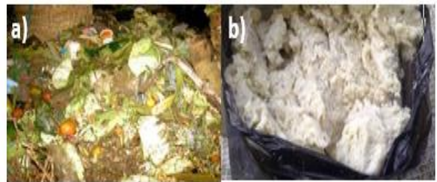
Gambar 1. (a)Sampah pasar, (b)Ampas tahu

Sampah yang digunakan dalam penelitian ini terdapat dua macam sampah yaitu ampas tahu dan sampah pasar. Ampas tahu diperoleh dari produsen tahu rumahan di Jalan Catur Tunggal No.35, Kecamatan Kemiling, Kota Bandar Lampung. Sampah pasar campuran (sayuran dan buah-buahan busuk) diperoleh dari Pasar Pagi di Kecamatan Kemiling. Pengambilan sampah untuk media pakan larva Hermetia illucens dilakukan dalam setiap hari Pukul 07.00 WIB. Jumlah sampah yang diambil setiap hari yaitu 3 kg sampah. Adapun sampel sampah ampas tahu dan sampah pasar dapat dilihat pada Gambar 1 .