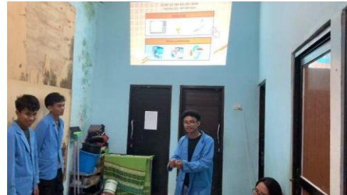
Gambar 2. Sesi Pemaparan Materi.

Dokumentasi pada sosialisasi Panti Asuhan Muara Kasih Bunda dapat dilihat pada gambar 1 sampai 4 berikut.