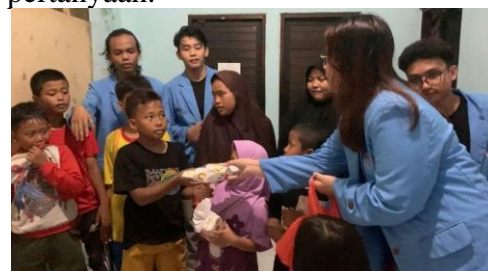
Gambar 4. Sesi Pembagian Hadiah

Selanjutnya sesi kedua yaitu sesi tanya jawab, anak-anak diberikan kesempatan untuk menjawab pertanyaan yang diberikan pemateri terkait dengan materi yang telah disampaikan, pada sesi ini anak-anak sangat antusias dalam menjawab pertanyaan.