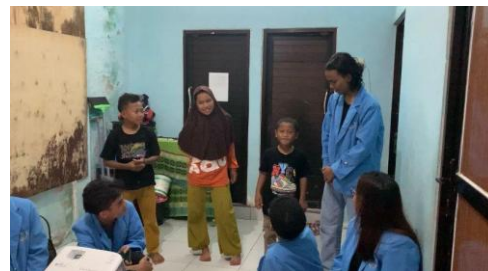
Gambar 3. Sesi Tanya Jawab

Pada sesi pertama ini, pemateri menjelaskan kepada anak-anak tentang penggunaan teknologi informasi dan menjaga keamanan data pribadi. Dimulai dari pengertian teknologi informasi, contoh sederhana teknologi informasi, dan cara menjaga data pribadi.