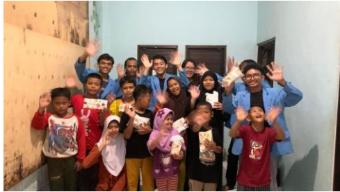
Gambar 5. Sesi Foto Bersama

Sesi ketiga yaitu pembagian hadiah, sesi ini merupakan sesi pembagian hadiah kepada anak-anak yang berhasil menjawab materi yang diberikan oleh pemateri.