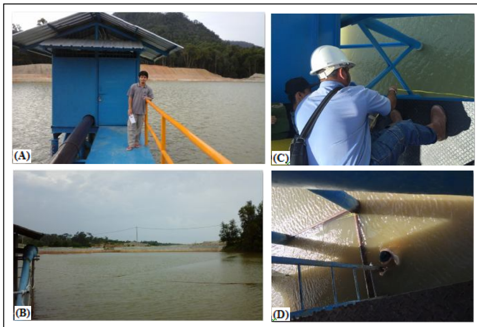
Gambar 2. Foto: (A) Kolong Argotirto, (B) Kolong Menjelang, (C dan D) Pengambilan perconto sedimen pada kolong Merawang dan Pedindang