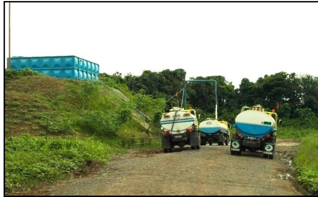
Gambar 3. Pembongkaran Perawatan, Mesin, Tangki Bahan Bakar Minyak Dan Pelumas (Penilaian Resiko Lemah)

Contoh-contoh kegiatan program pascatambang dengan penilaian risikonya.