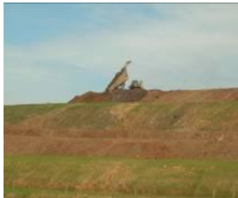
Gambar 4. Penataan Timbunan Tanah Penutup, Pengendali Erosi Dan Sedimentasi (Penilaian Resiko Sedang)