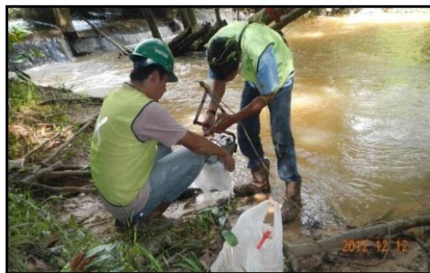
Gambar 5. Pemantauan Air Permukaan Dan Air Tanah (Penilaian Resiko Tinggi)