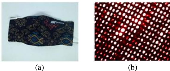
Gambar 1. (a) Masker kain, (b) Citra pori masker kain menggunakan aplikasi perbesaran.

Gambar 1 menunjukkan sampel masker kain yang akan dianalisis ukuran porinya. Terlihat jika citra pori masker kain yang diambil menunjukkan pori yang jelas. Penggunaan flash atau pencahayaan pada bagian bawah masker kain bertujuan untuk menghasilkan citra pori yang lebih jelas.